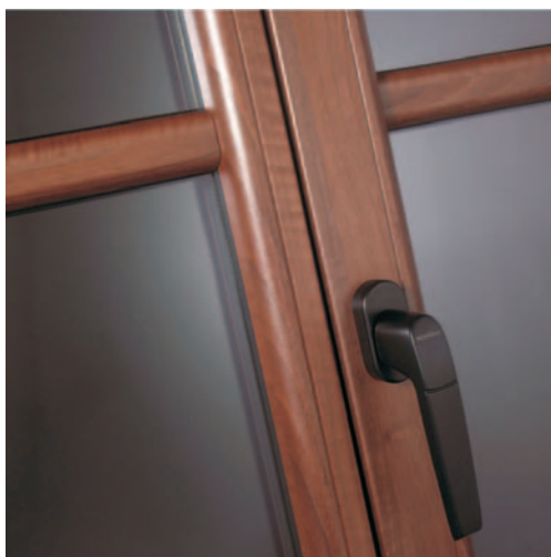
Goud en zilver gingen aan de Siena PR "Rosso" en Siena PN "Noce" van Cova Products.